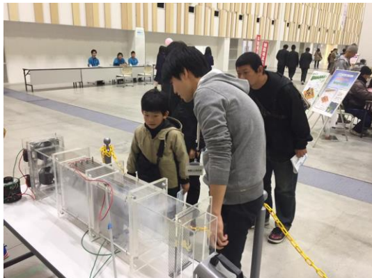
きれいになる空気をみて驚く少年