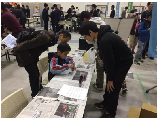
キーホルダー製作に熱中する少年