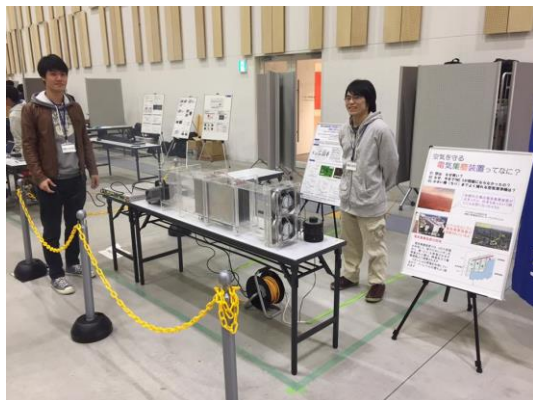
瑞慶覧研究室のメンバー